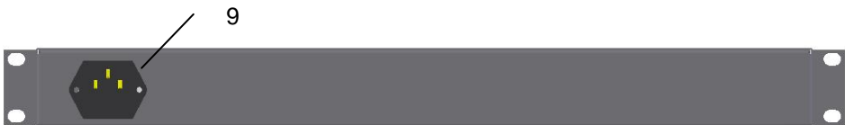
Рисунок 2. Вид сзади.